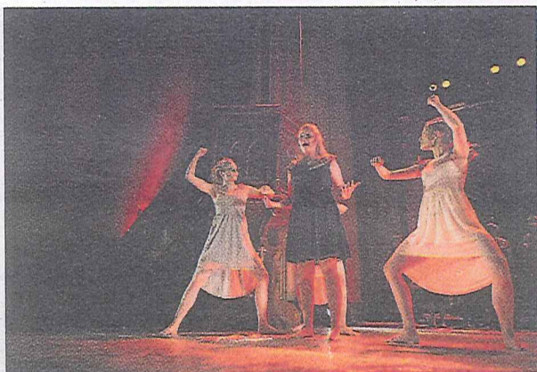
«KOYDON»: Fra premièren i Kulturkirken Jakob onsdag.