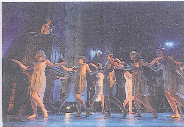
AMBISIØST: 50 aktører var på scenen i oppsetningen.